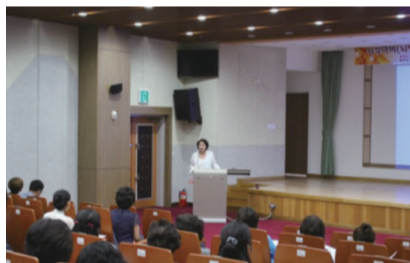
한발클럽 '뇌성마비 복지와 성년후견인제도 및 발달장애인법 교육' 행사지원(2014. 6. 25. 대전충청권역의료재활센터 3층 대강당에서)