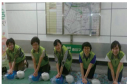
경희고황클럽 응급처치 재능나눔 (2014. 6. 동대문구 주민센터에서)