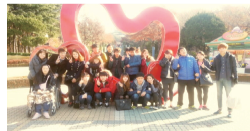
대구대클럽 장애인리와 현장체험학습 (2014. 6. 25. 시립미술관에서)

대구대 캠퍼스클럽은 지난 6월 25일(수) 대구보건학교 학생들과 함께 현장체험 학습을 다녀왔다. 이날 함께한 대구보건학교 학생들은 지적장애, 지체장애를 가진 아동들이며 팀을 나누어서 시립미술관(미술관 관람), 동성로(영화관람), 성서호플러스(시장놀이)를 체험하였다. 회원들은 이들과 함께하면서 새로운 것을 배우는 뜻 깊은 시간을 가졌다.