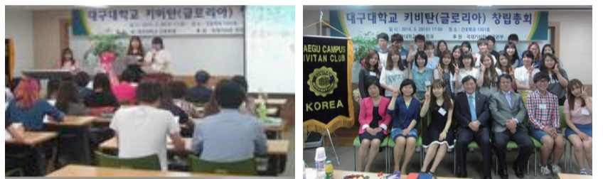
대구대 캠퍼스클럽 창립총회(2014. 5. 28. 대구대 간호학과에서)

장애어린이들이 있는 대구 보건학교에서는 회원들 간에 팀을 나누어 매주 교내 학습도우미, 식사 도우미, 진학 멘토 멘티 프로그램을 중심으로 활동하고 있다.