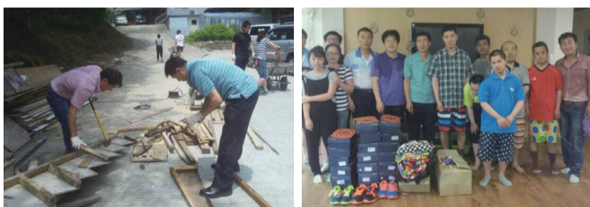
청풍클럽 '소망의 집' 방문 봉사 및 생필품 전달(2014. 7. 20. 괴산 '소망의 집'에서)