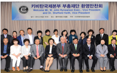
국제본부 부총재단 방한