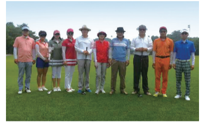
키비탄 친선골프대회(2014년 7월 27일(일) 충주 임페리얼골프장)

2014년 7월 27일(일) 충주 임페리얼골프장에서 '키비탄 친선골프대회'를 개최하였다.