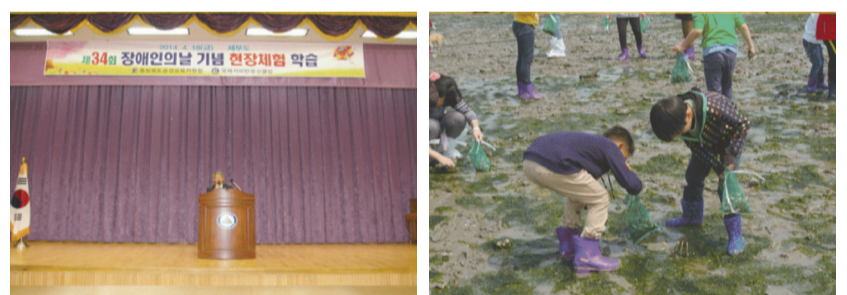
음성클럽 제34회 장애인의 날 기념 현장체험학습(2014. 4. 18. 제부도에서)