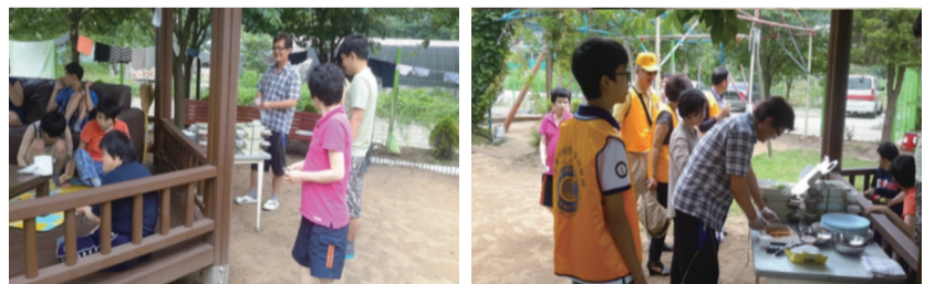
일산클럽 도시락봉사(2014. 6. 14. 미리내복지원에서)