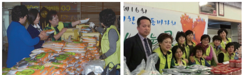
충주클럽과 미을클럽 제16회 장애인을 위한 합동바자회 개최(2014. 4. 22. 파라다이스웨딩홀 중앙홀에서)

충주클럽과 미을클럽은 이날 판매 수익금 전액을 장애인을 지원하기 위한 기금으로 사용할 계획이다.