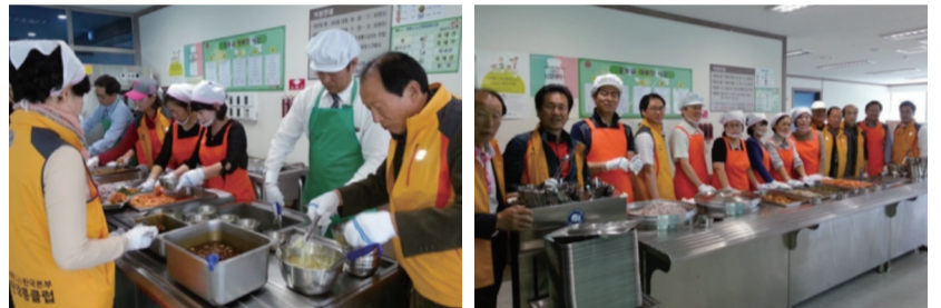
강릉클럽 배식봉사(2014. 5. 12. 및 6. 9. 홍제동노인회관 4층)

강릉클럽은 지난 4월 14일, 5월 12일, 6월 9일 '홍제동노인회관'을 방문하여 배식봉사를 실시하였다. 정기봉사를 꾸준히 하고 있는 회원들은 530여 어르신들께 정성을 담아 배식봉사를 했다.