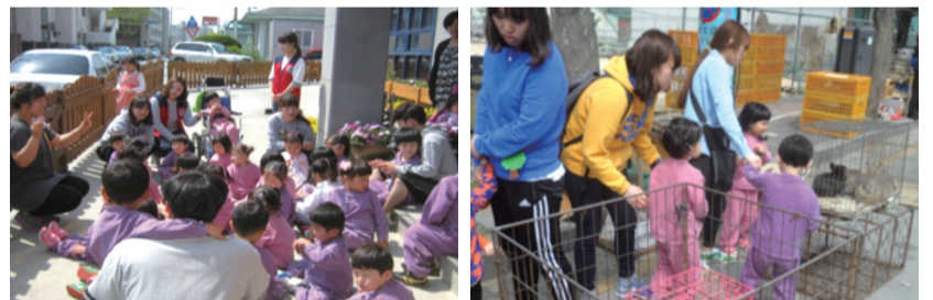
대전대 캠퍼스클럽 정기봉사(2014. 4. 느티나무어린이집 어린이들과 함께)

올해 창립된 대전대 캠퍼스클럽은 지난 4월부터 7월까지 13회에 걸쳐 장애아동 전담보육시설인 '느티나무어린이집'을 방문하여 봉사하였다. 대전대캠퍼스클럽 회원들은 장애아동 돌보기, 야외활동보조, 산책, 어린이집 청소, 세탁, 환경정리를 하며 보람된 시간을 가졌다. 또한 취약계층 어린이와 멘토 결연을 맺고 가정을 15회 방문하여 놀이친구, 읍내탐방, 정서지원 활동을 하며 적극 협력하였다.