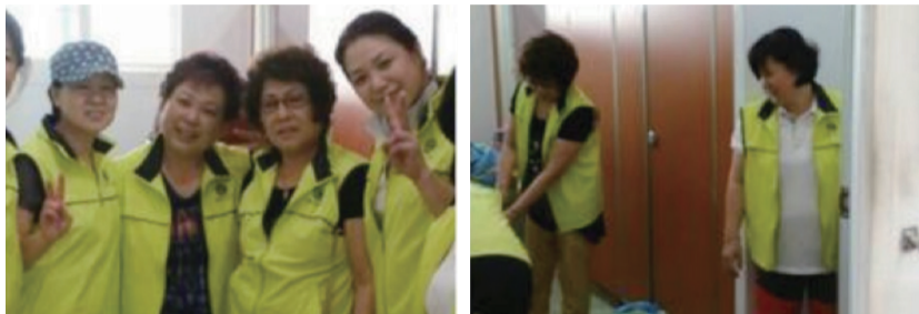
미울클럽 정기봉사(2014. 5. 10. 사람의 집에서)