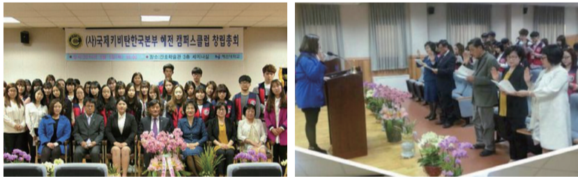
혜전대 캠퍼스클럽 창립총회(2014. 5. 1. 혜전대학교 간호학술관 3층 세미나실에서)