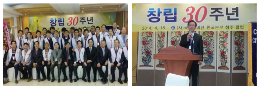
청주클럽 창립 30주년 기념식(2014. 4. 18. 청주시 가화한정식에서)