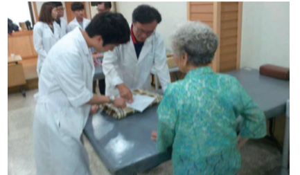
대전보건대클럽 '꽃피는 사랑병원' 현충일 의료봉사 지원 (2014. 6. 6. 월평종합사회복지관에서)

이다. 의사와 임상물리치료사 선배 그리고 대전보건대 캠퍼스클럽 회원들이 함께 봉사하였다.