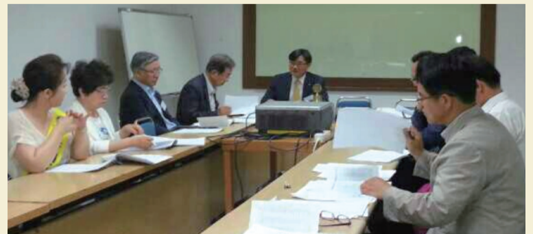
제7차 임시이사회(2014년 6월 28일 17:30 용인 한화리조트 매화실)

정 및 장소 변경 보고, 세월호 사고에 따른 키비탄어린이대잔치 9월 19일 일산호수공원으로의 연기에 관한 보고, 1/4분기 국제회비 납부 보고, 주니어 클럽의 캠퍼스클럽으로의 명칭 변경과 창립에 관한 보고, 제3호 의안 차입금에 관한 건과 2014년 추경예산에 관한 건이 원안대로 통과되었고, 제2호 의안 재규정 개정과 제정에 관한 건은 다음 이사회에서 다시 논의하기로 하였다.