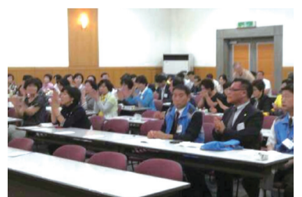
2014년 국제키비탄 한국본부 워크숍(2014. 6. 28. 용인 한화리조트에서)