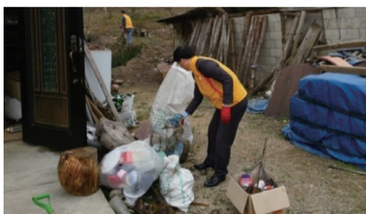
강릉클럽 장애인 가정 방문청소(2014. 4. 3.)