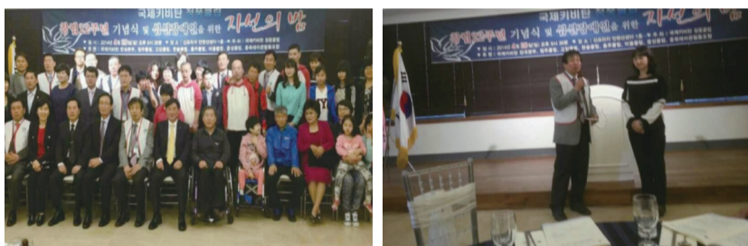
청풍클럽 창립 22주년 기념식 및 심신 장애인을 위한 자선의 밤 개최(2014. 4. 20. 선프라자 컨벤션센터에서)