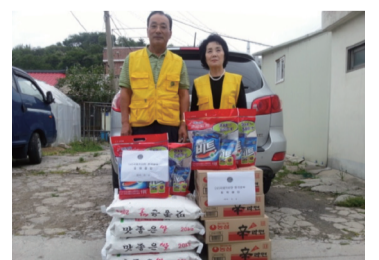
동해클럽 장애인 가정 생필품 전달 (2014. 6. 6. 발한동에서)