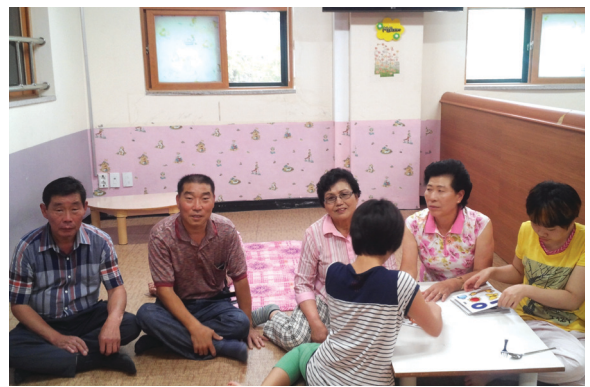
• 태백클럽 학생 목욕봉사 및 청소 실시 (2013.9.5. 태백 미래학교에서)