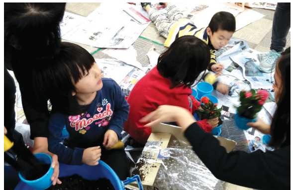
• (2013.10.5 등촌9동종합사회복지관에서)