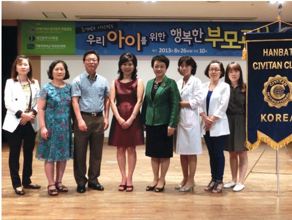
• 한밭클럽 「존경받고 사랑받는 우리 아이를 위한 행복한 부모교실」진행 (2013.8.26 대전성모병원 상지관 상지홀에서)

고 살아 있는 이야기를 주요 내용으로 진행하였다. 교육에 참석한 부모들은 함께 공감하면서 진정한 행복을 찾아가는 과정을 경험할 수 있는 귀한 시간이 되었다며, 앞으로도 이런 교육이 수시로 진행되었으면 좋겠다고 말했다.