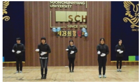
• 순천향대주니어클럽 제23회 창립제 개최 (2013.11.9 순천향대 인문대 대강당에서)