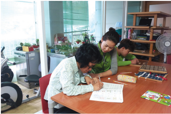
• 강릉아산클럽 학습지도봉사 실시 (2013.8.8 보람의집에서)