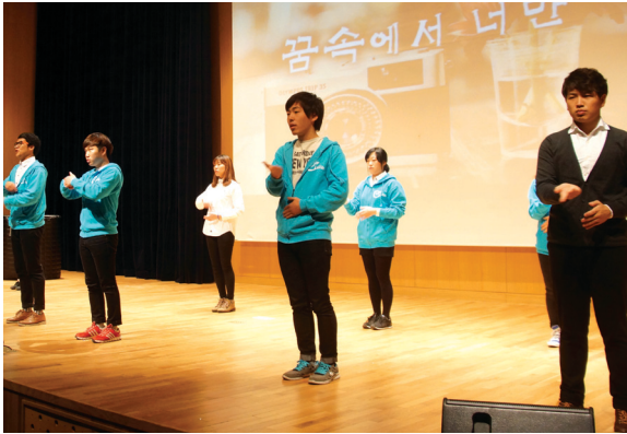
• 연세대주니어클럽 여키수연제 개최 (2013.11.22 연세대학교 원주캠퍼스 정의관에서)