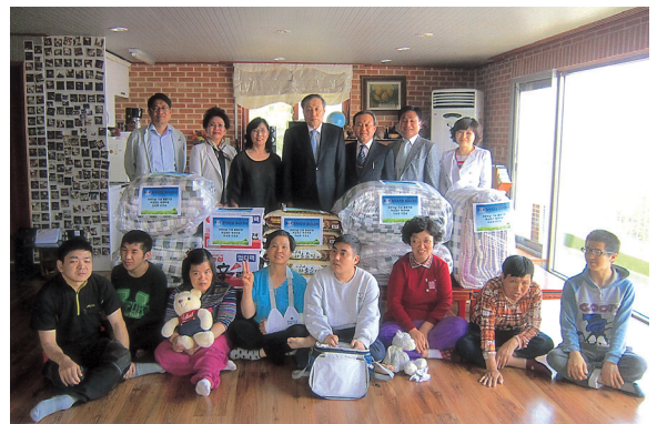
• 대전클럽 추석맞이 물품 및 금일봉 전달 (2013.9.17 장애인그룹홈 「실만한물가」에서)