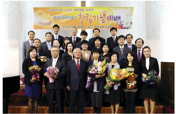
• 엔젤스클럽 「영락사회복지재단의 감사패」수상 (2013.10.1 영락교회 선교관에서)