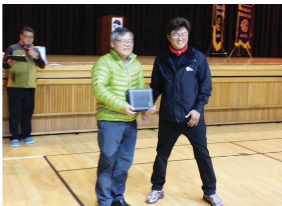
• 충청북도클럽 합동 월례회 및 체육대회 개최 (2013.11.9 음성체육관에서)