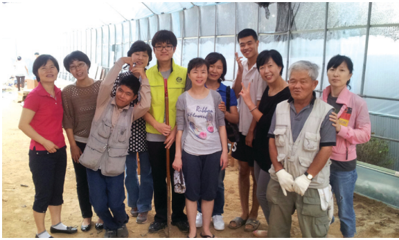
• 경희고향클럽 성폭력예방교육 재능기부 및 정기봉사 (2013.8.10 구리 살림의집에서)