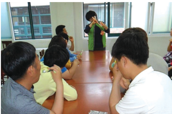
• 강릉아산클럽 보건교육 실시 (2013.에지탑에서)