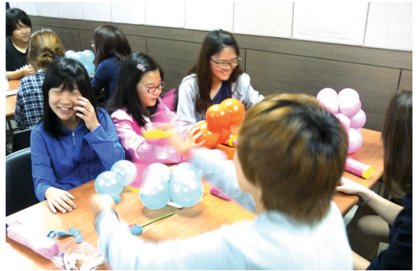
• 이화여대주니어클럽 「신나는 토요일」놀이 봉사 실시 (2013. 9. 7 등촌9동종합사회복지관에서)