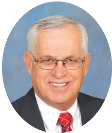
• 조 파커 총재