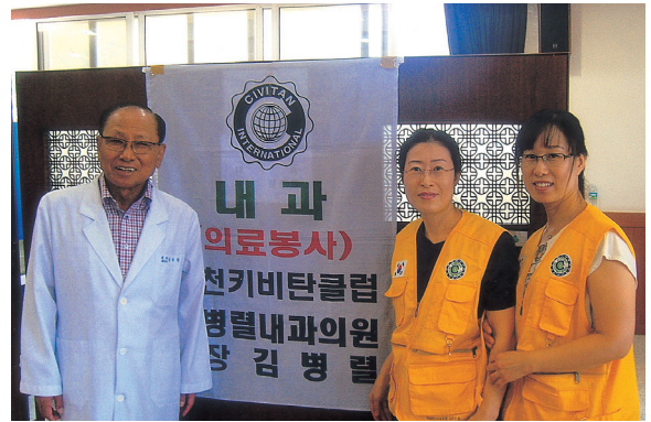
• 춘천클럽 '제35차 의료 및 주민생활 불편해소 무료봉사' 실시 (2013.8.25 강원도 인제군 서화면 사무소에서)