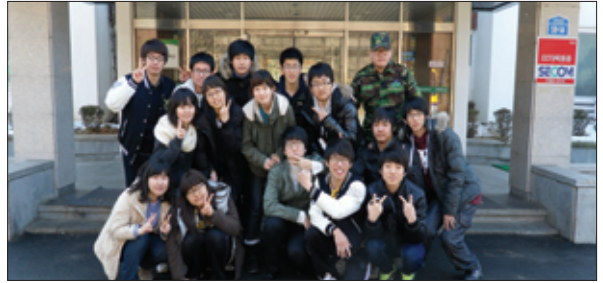
• 연세대클럽 '한사랑마을' 방학 중 봉사활동 2회 (2010.12.21~24. / 2011.2.17~20. 경기도 광주시 한사랑마을에서)

연세대클럽은 지난 2010년 12월 21일(화)부터 24일(금)까지, 2011년 2월 17일(목)부터 20일(일)까지 3박4일 동안 겨울방학을 이용하여 두 차례에 걸쳐 경기도 광주시에 위치한 중증장애인 생활시설인 '한사랑마을'에서 봉사활동을 하였다. 이번 두 차례의 봉사활동에는 각각 30명의 회원들이 참여하였다. 각 방마다 배정된 회원들은 하루 9시간씩 생활자들과 함께 목욕 및 식사보조, 여가 프로그램 등의 전반적인 생활 및 프로그램 보조를 하면서 생활자들과 함께 생활하였다. 지속적인 방문봉사로 회원들과 생활자들의 관계가 더욱 돈독해져 적극적인 봉사활동을 할 수 있었다.