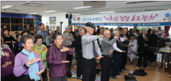
강릉아산클럽 '진강어르신 효도잔치' 행사 (2010.11.12. 강릉시 북부노인대학에서)