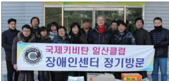
• 일산클럽 '소망복지원', '미리내집' 정기 봉사활동