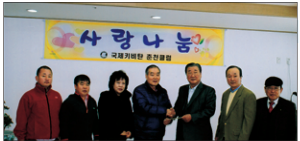
• 춘천클럽 '참사랑의 집' 봉사활동(2010.12.10. 강원도 춘천시 참사랑의 집에서)