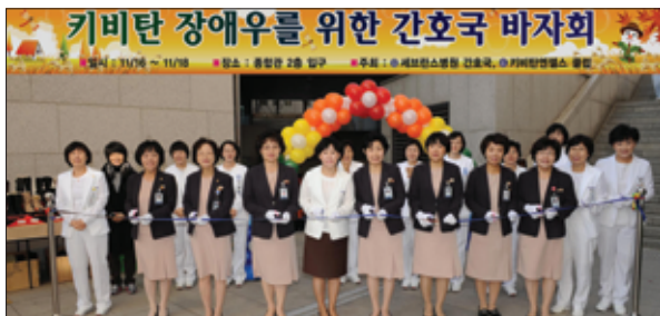
• 엔젤스클럽 '키비탄 장애우를 위한 자선바자회' (2010.11.16~18. 세브란스병원 종합관에서)