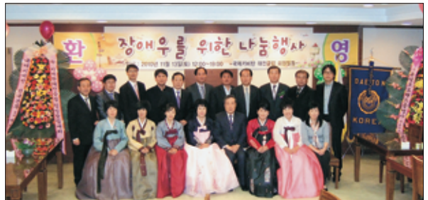
• 대전클럽 장애인을 위한 일일차집 (2010.11.13. 농협대사동지점에서)