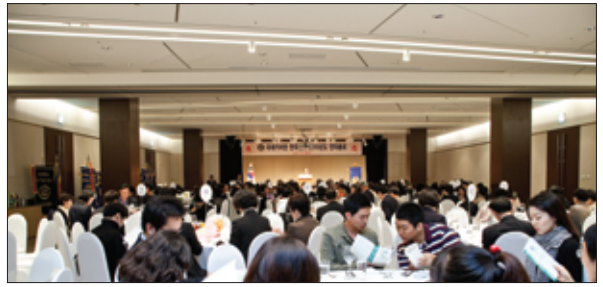
• 2010 국제키비탄 한국본부 연차총회(2010.10.20. 여의도 63빌딩 세쿼이아홀에서)