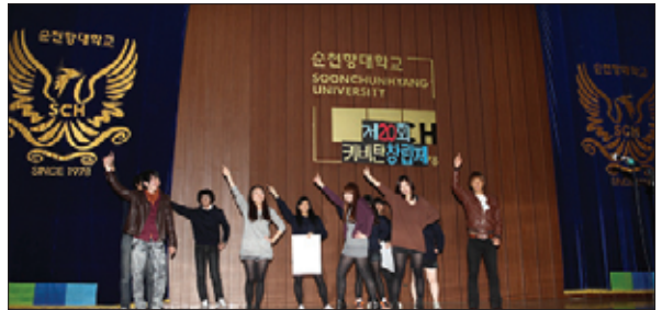
• 순천향대클럽 제20회 창립제(2010.11.13. 순천향대 인문대강당에서)