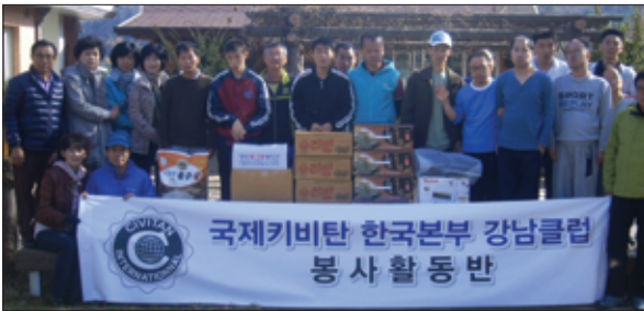
• 강남클럽 '생필품 전달 행사' (2010.11.13. 경기도 가평군 가난한 마음의 집 방문)