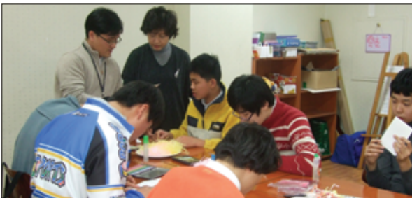
• 강남엔젤스클럽 ‘하상장애인복지관’ 정기 봉사활동