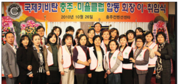
• 충주 · 미을클럽 합동 회장 이 · 취임식(2010.10.26. 충주컨벤션센터 환타지홀에서)