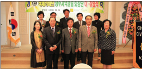
• 청주지역클럽 합동 회장 이·취임식(2010.10.14. 청석컨벤션센터 티아라에서)