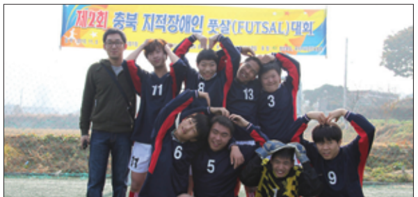
• 한솔클럽 제2회 충북 지적장애인 체육대회 '풋살대회' (2010.11.5. 직지 풋살 경기장에서)