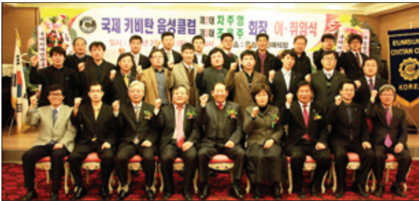
• 음성클럽 제2대·3대 회장 이·취임식(2011.2.15. 음성대원예식장 영빈관에서)