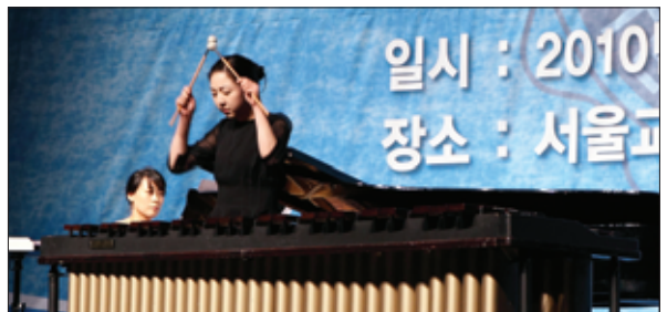
• 제36회 국제키비탄 한국본부 자선음악회(2010.11.27. 서울교육문화회관 대극장에서)