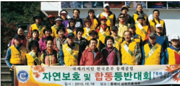
• 동해, 강릉, 태백, 강릉아산클럽 10월 합동 등반대회 (2010.10.16. 동해시 삼화무릉계곡에서)