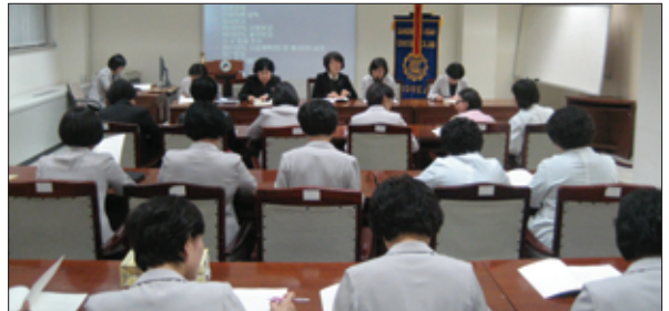
• 강릉아산클럽 제7회 정기총회 (2010.12.1. 강릉아산병원 세미나실에서)