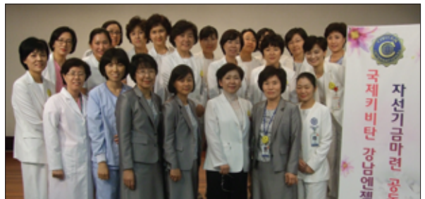
• 강남엔젤스클럽 자선기금 마련 공동구매 행사