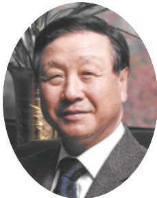
• 박창일 총재