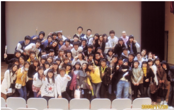
• 연세대클럽 수화발표회 (2009. 11. 23. 연세대학교 첨단의료기기 대강당에서)