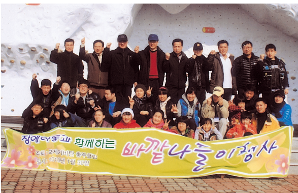
• 충주클럽 장애아동 초청 바깥나들이 행사(2010. 1. 30. 청풍리조트에서)