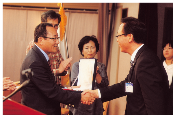
• 2009 국제키비탄 한국본부 연차총회(2009. 10. 13. 여의도 63빌딩 코스모스홀에서)