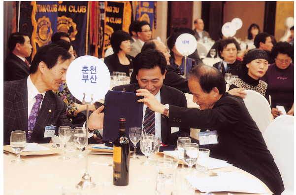
• 2009 국제키비탄 한국본부 연차총회(2009. 10. 13. 여의도 63빌딩 코스모스홀에서)