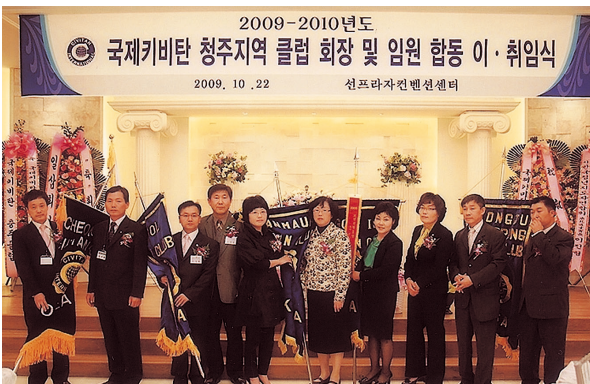
• 청주지역클럽 회장 합동 이·취임식 (2009. 10. 22. 청주시 선프라자 컨벤션센터에서)

청주지역클럽은 지난 2009년 10월 22일(목) 오후 6시 30분 청주시 선프라자 컨벤션센터에서 회장 합동 이·취임식을 가졌다.