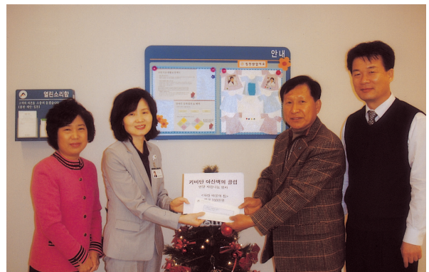
• 아산백의클럽 연말 사랑나눔행사 (2009. 12. 23. 서울아산병원에서)