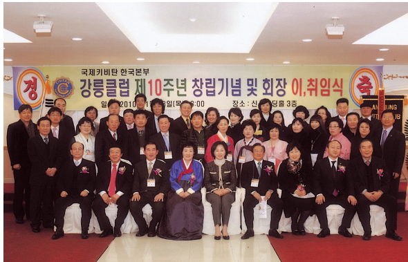
강릉클럽 창립 10주년 기념 및 회장 이·취임식 (2010. 1. 28. 강릉시 동해관 3층 신신웨딩홀에서)