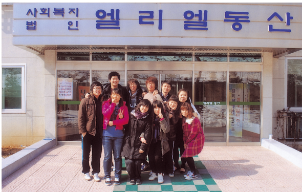
• 연세대클럽 '엘리엘 동산' 방학중 봉사활동 (2010. 2. 18~20. 경기도 이천시 '엘리엘 동산'에서)