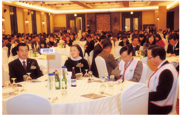
• 충주클럽 제25회 심신장애인을 위한 희망의 밤 (2009. 12. 3. 청주시 선프라자 컨벤션센터에서)