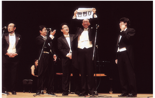
• 제35회 한국키비탄 자선의 밤(2009. 11. 17. 서초동 한전아트센터에서)