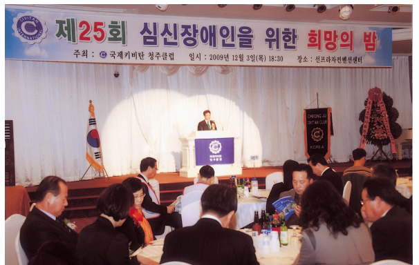
• 청주클럽 제25회 심신장애인을 위한 희망의 밤 (2009. 12. 3. 청주시 선프라자 컨벤션센터에서)