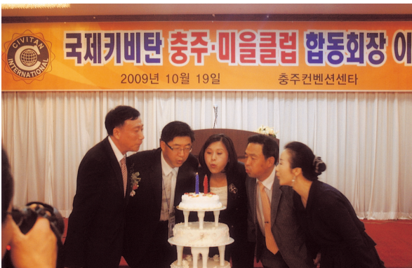
• 충주·미술클럽 합동 회장 이·취임식(2009. 10. 19. 충주시 충주컨벤션센터에서)