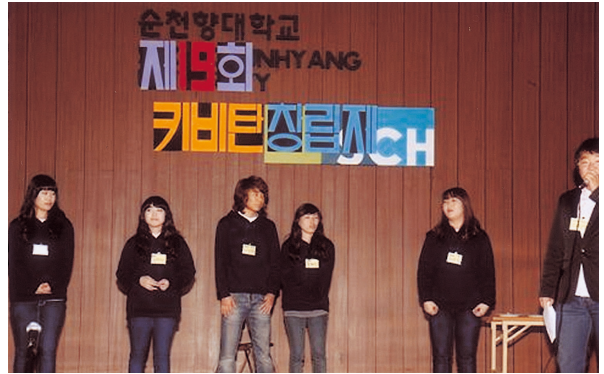
• 순천향대클럽 제19회 창립제 (2009. 11. 14. 순천향대학교 인문대 대강당에서)