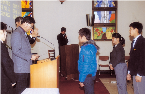
• 충주클럽 장학금 전달 (2010. 2. 8. 충주시 충주성심학교에서)