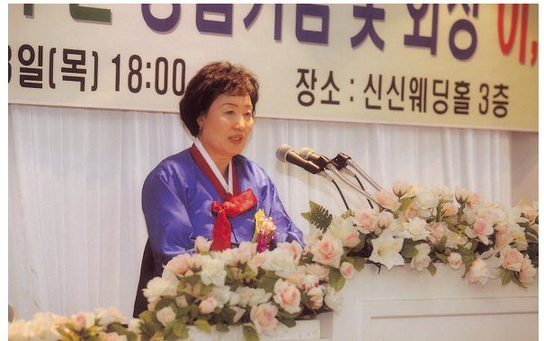
• 강릉클럽 창립 10주년 기념 및 회장 이·취임식(2010. 1. 28. 강릉시 동해관 3층 신신웨딩홀에서)