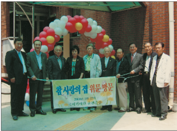
• 춘천클럽 장애인시설에서 봉사활동(2008.5.22. 춘천시 우두동 계명 복지재단에서)