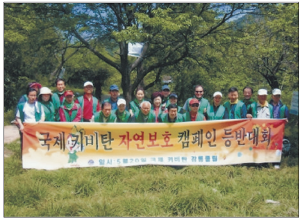
• 강릉클럽 동해클럽과 합동 자연보호 캠페인(2008.5.21. 강원도 대관령 옛길에서)