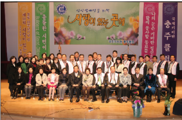
• 충주클럽 창립10주년 및 제10회 사랑이 있는 곳에(2008.3.8. 충주시 호암문화 예술회관에서)

광명클럽은 5월 24일(토) 오전 9시부터 오후 5시까지 광명시 장애인복지관 장애아동 30여 명과 광명클럽 회원 10여 명이 함께 양주 조명박물관을 견학하여 체험학습을 통해 즐거운 시간을 보냈다.