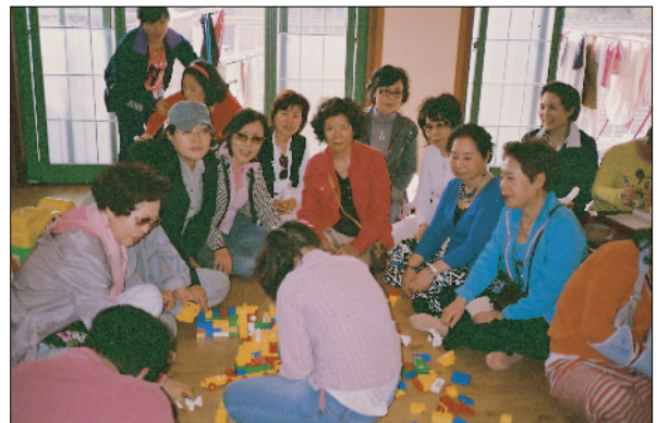
• 썬클럽 울산 태현 학교에서 봉사활동(2008. 4. 15~16. 경북 울산 태현학교에서)