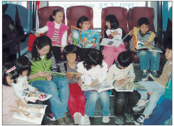
• 강릉아산클럽 봉사활동(2008.4. 매월 2회씩 찾아가는 네이버 책 버스에서)