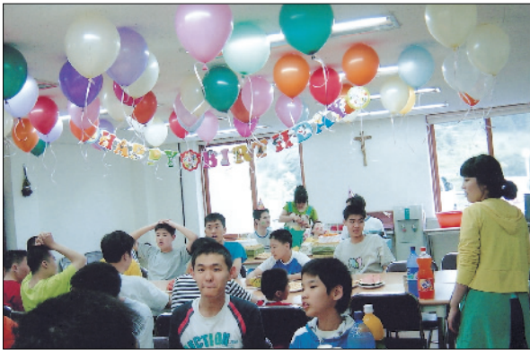
• 한마음클럽 생일잔치(2008. 5. 28. 청원군 보듬의 집에서)