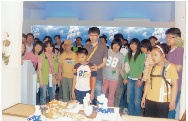
• 광명클럽 광명시 장애인 복지관 장애우와 나들이(2008.5.24. 양주 조명 박물관에서)