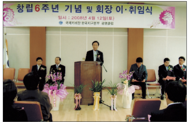
• 광명클럽 회장 이·취임식 및 창립 6주년 행사(2008. 4. 12. 광명시 철산2동 주민센터 3층에서)