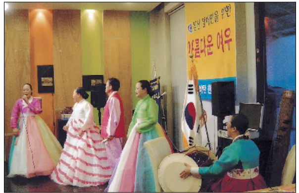
• 한마음클럽 심신장애인을 위한 자선의 밤(2008. 4. 29. 청주시 상당구 용암동 그림팍에서)