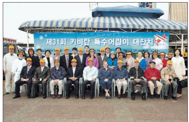
• 키비탄 특수어린이 대잔치 (2008. 5. 13. 한강유람선 선착장에서)