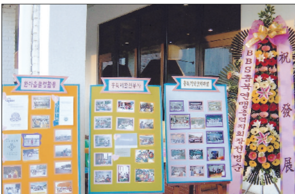
• 한마음클럽 심신장애인을 위한 자선의 밤(2008. 4. 29. 청주시 상당구 용암동 그림팍에서)