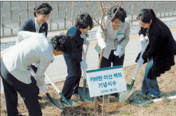
• 아산백의클럽 식목행사(2008.4.5. 서울아산병원 신관 뒤편 정원에서)