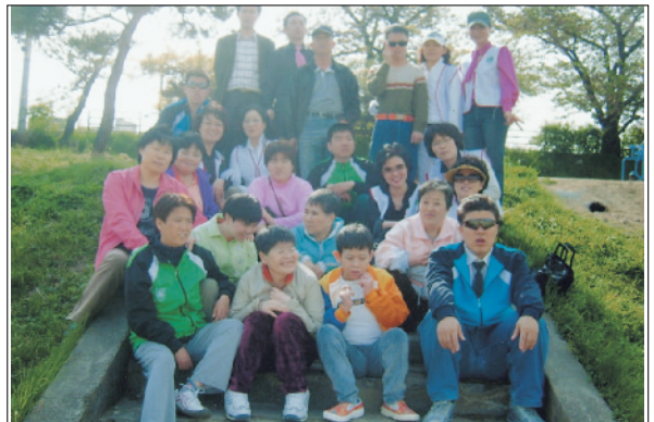
• 고임클럽 장애인들과 벚꽃구경(2008.4.16. 청주시 무심천에서)