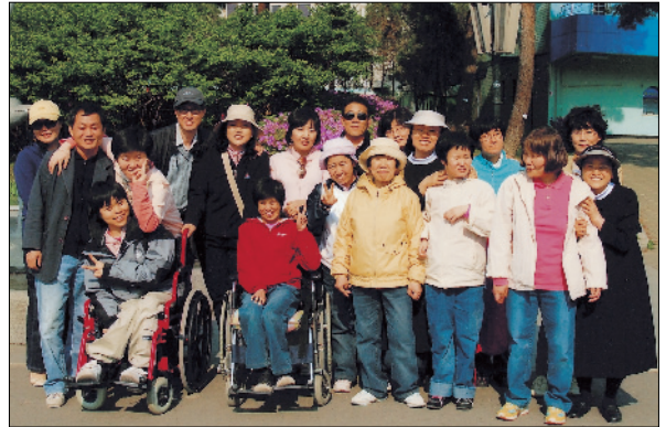
• 국클럽 심신장애인 바깥세상 보여주기(2008. 4. 24. 과천 서울랜드에서)

춘천클럽은 지난 5월 22일(목) 오전 11시부터 오후 2시까지 춘천시 우두동 계명복지재단 산하 참사랑의 집과 강원명진학교 언어장애인 시설을 방문하여 풍선이벤트와 함께 클럽 회원들이 직접 준비한 점심과 떡, 다과를 나누면서 300여 명의 원생들과 즐거운 시간을 보냈다.