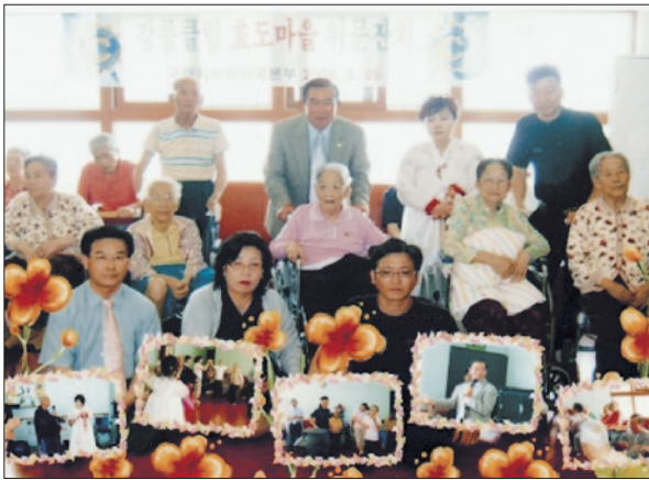
• 강릉클럽 강릉 효도, 다사랑 마을 위문잔치(2008.5.25. 강릉시 강릉 효도 다사랑 마을에서)