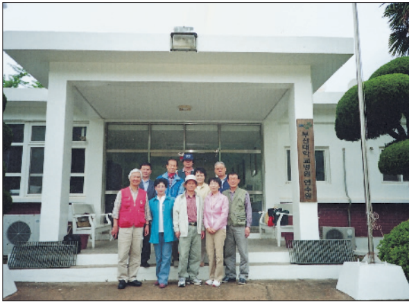
• 부산클럽 월례회 겸 단합대회(2008.5.9-10. 거제도 칠전도 부산대학교병원 연수원에서)