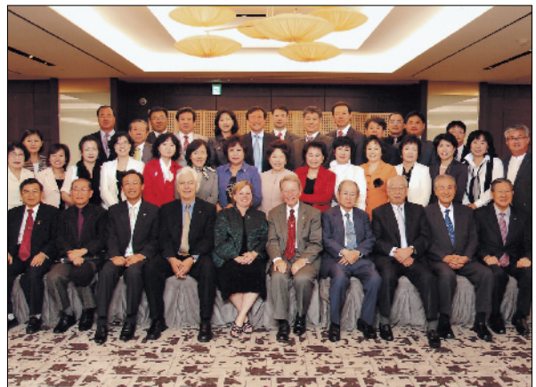
• 국제본부 총재단 환영만찬회(2008. 5. 12. 롯데호텔 36층 아스트로룸에서)