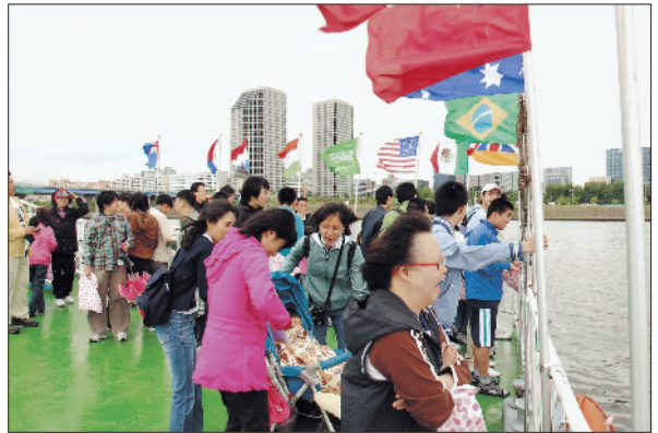
• 키비탄 특수어린이 대잔치(2008. 5. 13. 한강유람선 선착장에서)