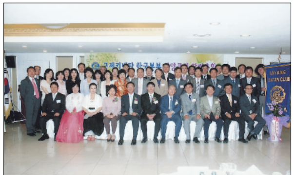
• 안양클럽 창립총회(2008. 5. 17. 안양 삼원프라자 호텔 3층 코스모스홀에서)