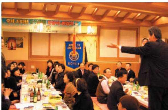
• 광주클럽 회장 이 · 취임식 (2007. 1. 4. 광주시 동해바다회관에서)

광명클럽은 지난 2006년 11월 6일(월) 오전 10시부터 오후 5시까지 광명 에덴호프에서 '장애아동돕기 일일차집'을 개최하였으며 광명시장이 참석하여 참석회원들을 격려하였다. 일일차집의 수익금은 본부 100인 위원회 기금으로 50만원을 전달하고, 나머지 수익금은 광명시에 사는 장애아동 가정에 지원금으