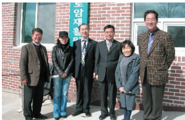
• 광주클럽 2월 봉사활동 (2007. 2. 14. 광주시 실로암 재활원에서)