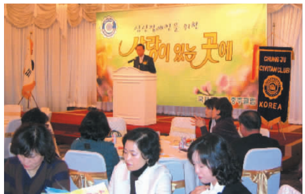
• 충주클럽 제9회 장애인을 위한 사랑이 있는 곳에 (2007. 2. 27. 충주 후렌드리 호텔 대연회장에서)