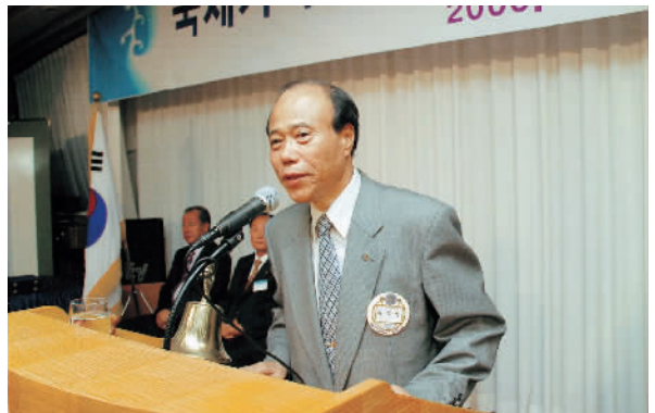
• 2006 국제키비탄 한국본부 연차총회(2006. 10. 18. 여의도 63빌딩 코스모스홀에서)