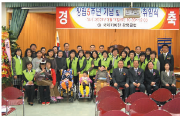
• 광명클럽 제5회 창립기념 및 장애아동 기금 전달식 (2007. 3. 17. 광명 장애인복지관 3층에서)