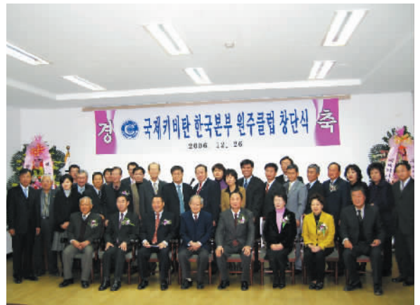
• 원주클럽 창립총회 (2006. 12. 26. 원주 상공회의소 1층 대회의실에서)