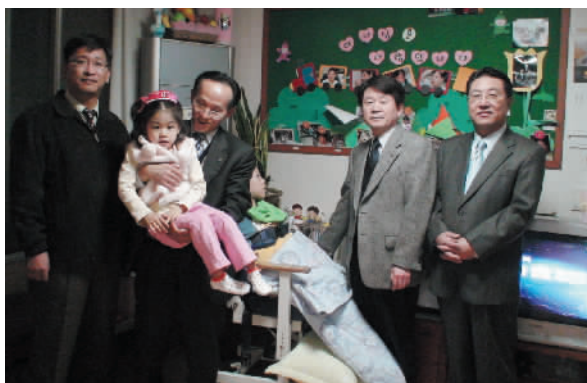
• 수원클럽 중증장애아동 보호시설 방문 (2006. 12. 20. 에벤에셀의 집에서)