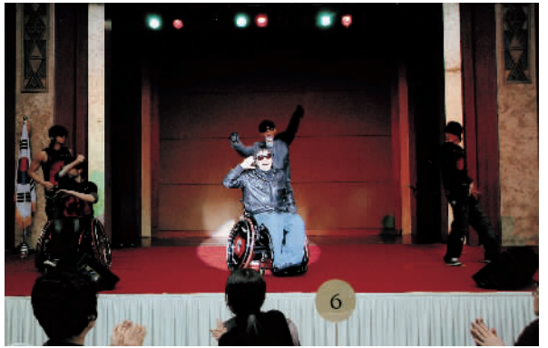
• 제32회 한국키비탄 자선의 밤(2006. 12. 12. 롯데호텔 크리스탈 볼룸에서)