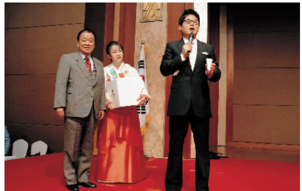
• 제32회 한국키비탄 자선의 밤(2006. 12. 12. 롯데호텔 크리스탈 볼룸에서)