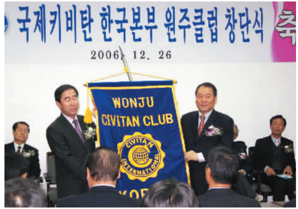
• 원주클럽 창립총회 (2006. 12. 26. 원주 상공회의소 1층 대회의실에서)