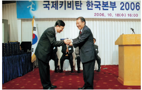
• 2006 국제키비탄 한국본부 연차총회(2006. 10. 18. 여의도 63빌딩 코스모스홀에서)