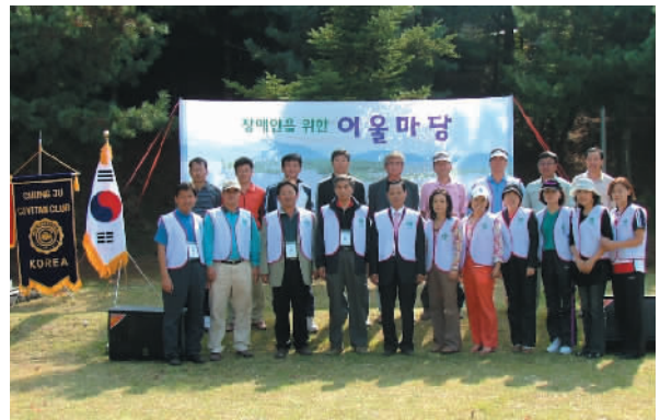
• 충주클럽 2006 장애인과 함께하는 어울마당 (2006. 10. 14. 충주 MBC 잔디광장에서)

충주클럽은 지난 2006년 10월 14일(토) 오전 10시부터 오후 3시까지 충주 MBC 잔디광장에서 '2006 장애인과 함께하는 어울마당' 행사를 가졌다. 이 행사는 장애우들의 재활의지를 돕고 자원봉사자 및 시설관계자들을 격려하며 회원 간의 단합과 봉사정신을 고취하고 홍보활동을 통하여 키비탄의 정신을 널리 홍보하기 위함이다. 이날 충주클럽 회원 30명, 자매클럽회원 20명, 봉사자 및 시설 관계자 150명과 장애우 150명 등 350명이 참석하여 페이스페인팅, 떡메치기, 이동노래방 등을 하면서 장