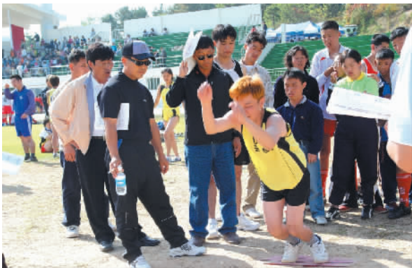
• 한솔클럽 제7회 충북 정신지체인체육대회 (2006. 10. 11. 청원군 공설운동장에서)

한솔클럽은 지난 2006년 10월 11일(수) 오전 10시부터 오후 5시까지 청원군 공설운동장에서 한솔클럽 주관, 충북정신지체인 애호협회가 주최하고 충청북도, 청원군, 한국장애인복지시설 충북협회, 충북지역 키비탄클럽 후원으로 '제7회 충북정신지체인 체육대회'가 개최되었다. 이번 행사는 충북재활원, 아름마을, 세하의집, 청주성신학교, 청주혜원학교, 재천청암학교, 충북장애인종합복지관, 혜원장애인종합복지관, 옥천노인장애인복지관 등 9개의 참가단체에서 800여 명(선수 및 각 단체 600명, 키비탄 회원 70명, 자원봉사자 130명)이 참석하여 육상과 축구 경기가 있었다. 올해 일곱 번째로 개최된 이 행사는 장애인들의 능동적인 참여를 통해 우정과 화합을 도모함과 동시에 신체적 기능회복 및 재활의욕을 고취시키면서 지역주민의 관