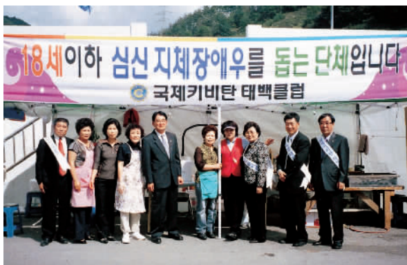
• 태백클럽 불우이웃 돕기 행사 (2006. 9. 30. ~ 10. 1. 태백 공설운동장에서)