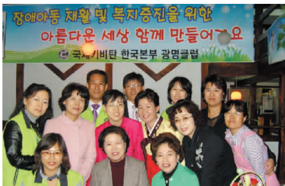
• 광명클럽 일일차집 (2006. 11. 6. 광명 에덴호프에서)