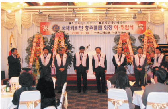
• 충주클럽 제9대 회장 이·취임식 (2006. 11. 14. 충주 후렌드리 호텔에서)