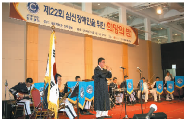
• 청주클럽 제22회 희망의 밤 (2006. 12. 5. 청주 라마다프라자호텔 3층 직지홀에서)